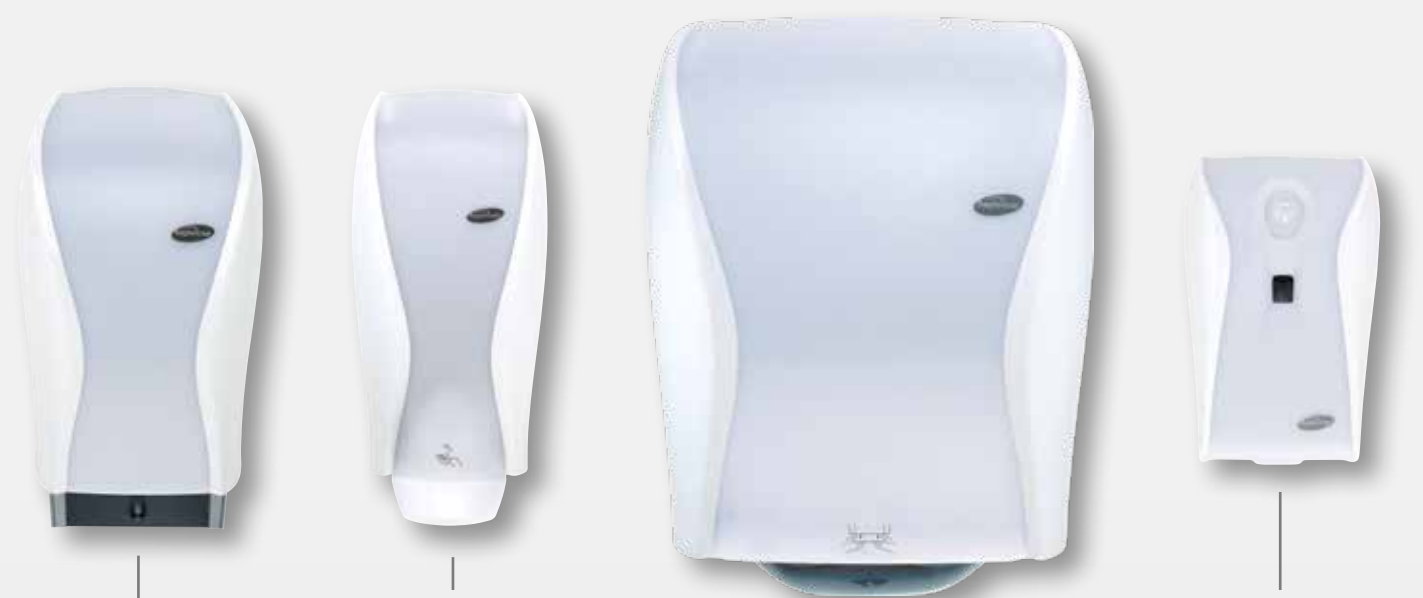
XIBU touchTISSUEPAPER white