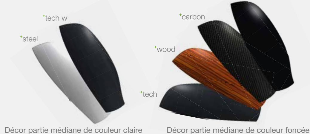
Décor partie médiane de couleur claire

Vous entrez dans une salle de bain et vous rencontrez une atmosphère accueillante – un parfum frais embaume l'air; le design des robinetteries et des distributeurs s'intègre dans l'environnement. Avec XIBU vous accordez à vos clients, ainsi qu'à vous-même ces moments agréables. Vous choisissez les robinets et les décors correspondants à votre concept de salle de bain. Offrez à vos clients ainsi qu'à vous-même la dernière génération de distributeurs hygiéniques! *black