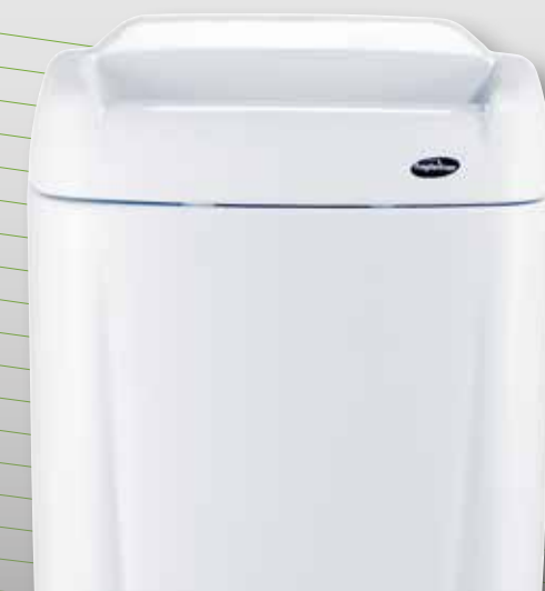
XIBU touchPAPERBOX bL