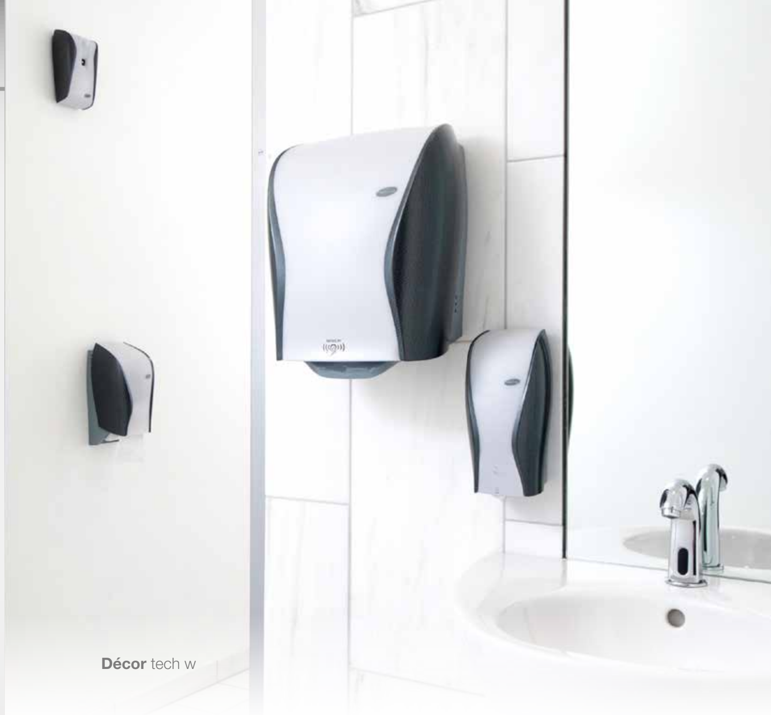
Décor tech w